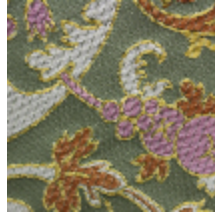
1655-05 CERNUSCHI- VERT