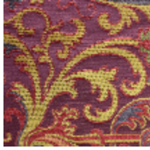
1655-03 CERNUSCHI- POURPRE