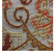
1655-07 CERNUSCHI- IVOIRE