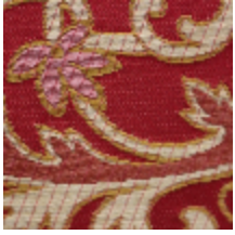
1655-01 CERNUSCHI- ROUGE