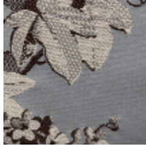
1656-04 OFFENBACH- BLEU