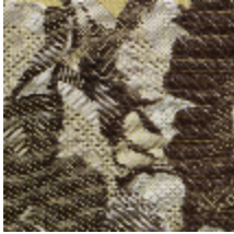
1656-02 OFFENBACH-OR *