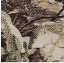
1656-03 OFFENBACH- IVOIRE