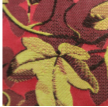
1656-01 OFFENBACH- ROUGE *