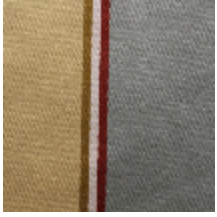
1659-02 MARIGNY-BOIS *