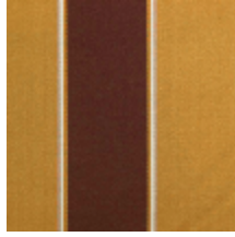
1659-04 MARIGNY-NATUREL *