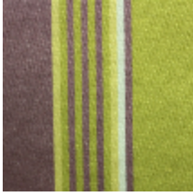
1659-03 MARIGNY-JAUNE *