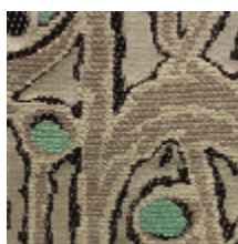
1660-02 LALIQUE - IVOIRE