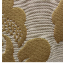
1661-04 COURSON - OR