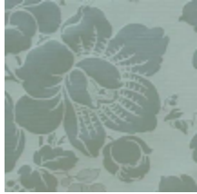
1661-01 COURSON - NATTIER