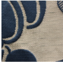
1661-08 COURSON - BLEU