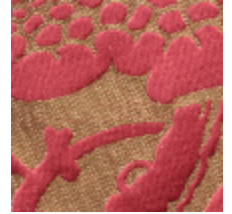
1661-07 COURSON - RUBIS *