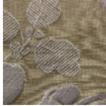
1661-03 COURSON - PERLE