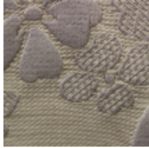
1661-02 COURSON - IVOIRE