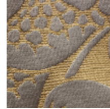
1661-05 COURSON - TAUPE *