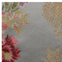
1662-03 CHOISY S&D - PASTEL