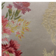
1662-01 CHOISY S&D - IVOIRE