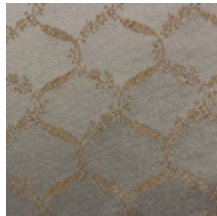
1663-03 CHOISY SEMÉ - PASTEL