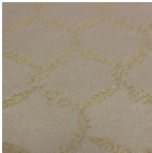
1663-02 CHOISY SEMÉ - TILLEUL *