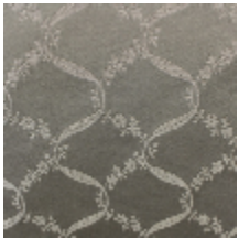
1663-01 CHOISY SEMÉ - IVOIRE