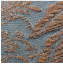
1664-08 TRIANON - BLEU