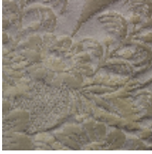
1664-02 TRIANON - PERLE