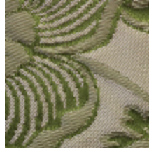
1664-04 TRIANON - VERT