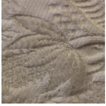
1664-01 TRIANON - IVOIRE