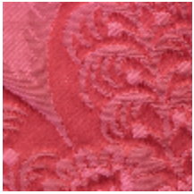
1664-07 TRIANON - RUBIS