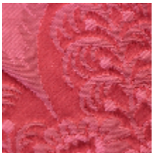
1664-07 TRIANON - RUBIS