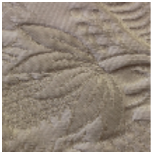
1664-01 TRIANON - IVOIRE