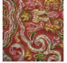
1665-06 GUIMET - ROUX