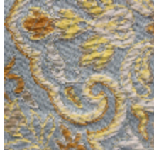
1665-03 GUIMET - NATTIER