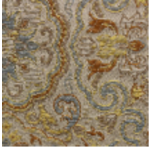
1665-01 GUIMET - IVOIRE