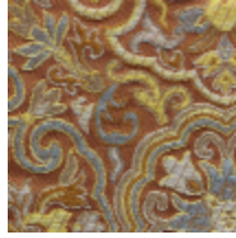
1665-04 GUIMET - BOIS