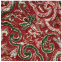
1665-07 GUIMET - RUBIS