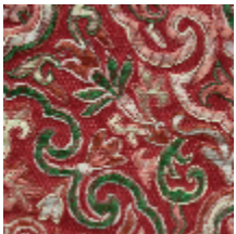
1665-07 GUIMET - RUBIS