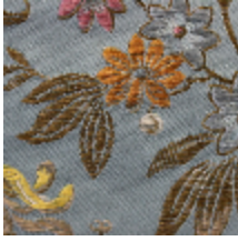
1666-02 FERRIERES - NATTIER