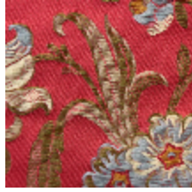
1666-03 FERRIERES - RUBIS