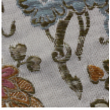
1666-01 FERRIERES - IVOIRE