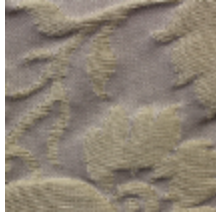
1668-02 GRAND DAUPHIN - PLATINE