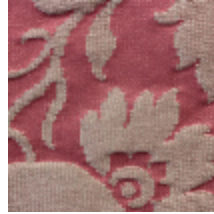
1668-06 GRAND DAUPHIN - TAMARIS