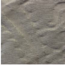
1668-01 GRAND DAUPHIN - IVOIRE