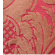
1668-07 GRAND DAUPHIN - ECARLATE