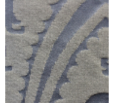
1668-08 GRAND DAUPHIN - ROYAL