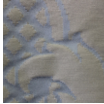
1668-04 GRAND DAUPHIN - SEVRES