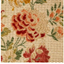
1678-01 POMPADOUR - IVOIRE