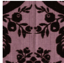
1681-05 MANSART - AMETHYSTE