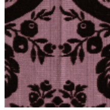
1681-05 MANSART - AMETHYSTE