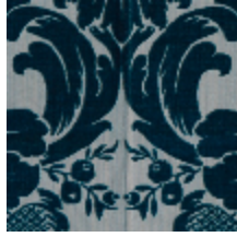
1681-03 MANSART - BLEU