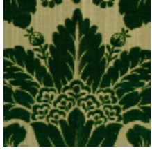
1681-01 MANSART - VERT