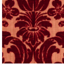
1681-04 MANSART - RUBIS