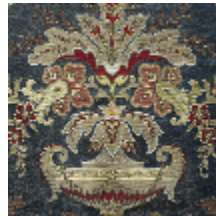
1683-04 VERDI - SAPHIR