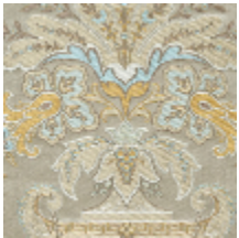
1683-01 VERDI - ARGENT