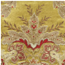
1683-02 VERDI - OR