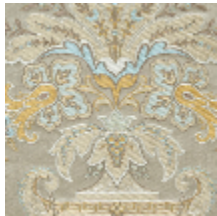
1683-01 VERDI - ARGENT