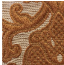
1691-04 LEONARDO - ECAILLE