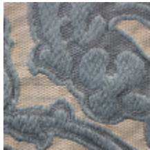
1691-01 LEONARDO - NATTIER