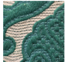
1691-06 LEONARDO - MYRTHE