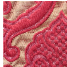
1691-05 LEONARDO - RUBIS