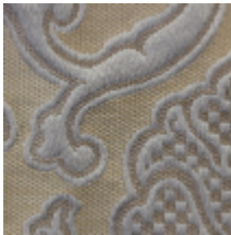
1691-02 LEONARDO - EMAIL