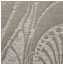
1694-02 VITRAIL - CHRYSLER