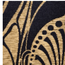
1694-05 VITRAIL - COUPOLE