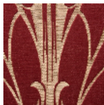
1694-04 VITRAIL - LAQUE