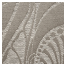
1694-02 VITRAIL - CHRYSLER