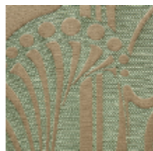
1694-01 VITRAIL - OPALINE