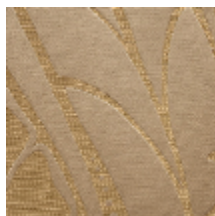
1694-03 VITRAIL - DORE