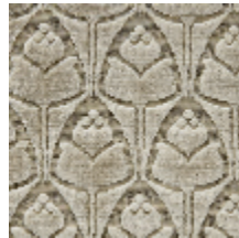
1695-03 TULIPES - CRISTAL