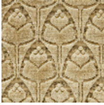
1695-02 TULIPES - OR