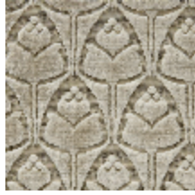
1695-03 TULIPES - CRISTAL