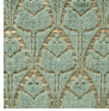
1695-04 TULIPES - JADE