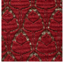
1695-01 TULIPES - CORNALINE