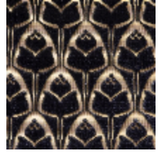
1695-06 TULIPES - ORAGE