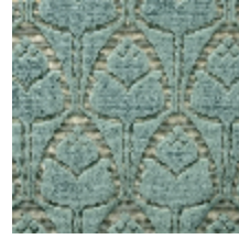
1695-05 TULIPES - PORCELAINE