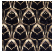
1695-06 TULIPES - ORAGE