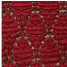
1695-01 TULIPES - CORNALINE