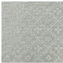
1698-01 CORSET - OPALE