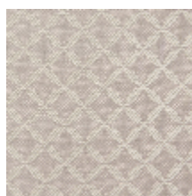
1699-04 GUIPURE - POUFRE