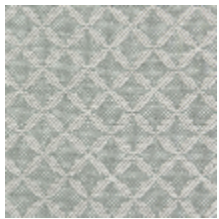
1699-01 GUIPURE - OPALE