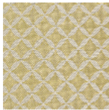
1699-03 GUIPURE - OR