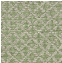
1699-02 GUIPURE - AMANDE