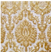
1701-02 CAMMINO - OR