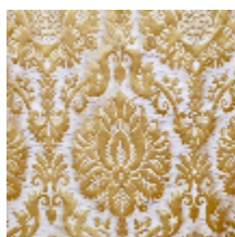
1701-02 CAMMINO - OR