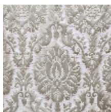
1701-03 CAMMINO - ARGENT