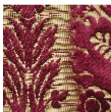
1701-01 CAMMINO - RUBIS