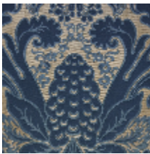
1703-02 MONCEAU - BLEU