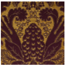
1703-01 MONCEAU - PRUNE