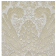
1703-03 MONCEAU - CHAMPAGNE