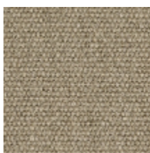
3212-02 SORBIER - LIN