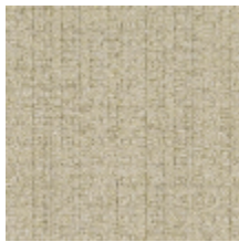
3217-02 HEVEA - FICELLE