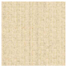
3217-01 HEVEA - GRES