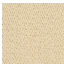
3218-01 EPICEA - GRES