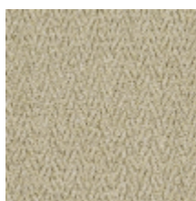
3218-02 EPICEA - FICELLE