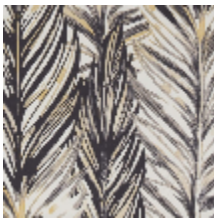
3224-02 PAMPAS - POIVRE