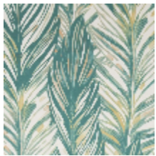
3224-01 PAMPAS - AGAVE