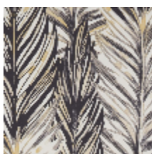
3224-02 PAMPAS - POIVRE