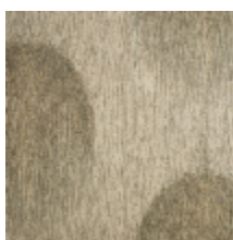
3226-02 OMBRAGE - FUSAIN