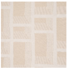
3227-01 DISTRICT M1 - NATUREL