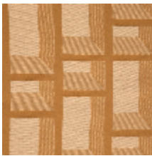
3227-02 DISTRICT M1 - CAMEL