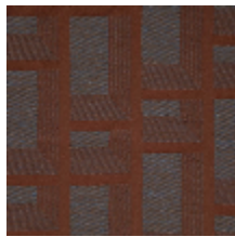
3227-03 DISTRICT M1 - JASPE