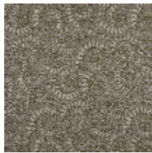
3233-03 AMMONITE - KAKI