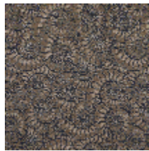
3233-04 AMMONITE - BOISE