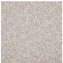
3233-01 AMMONITE - NATUREL