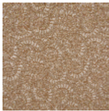
3233-02 AMMONITE - OCRE