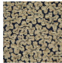
3237-05 CORAUX - NUIT