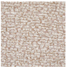
3237-01 CORAUX - NACRE