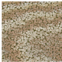
3237-03 CORAUX - KAKI