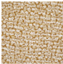
3237-02 CORAUX - OCRE