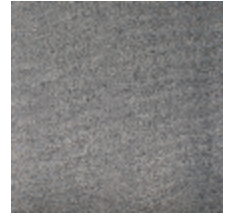
0324-39 NABAB - CHARTREUX