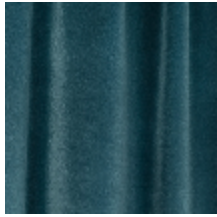
0324-08 NABAB - PETROLE