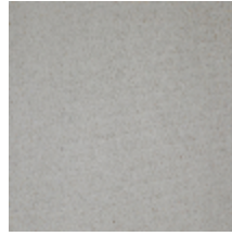
0324-37 NABAB - PERLE