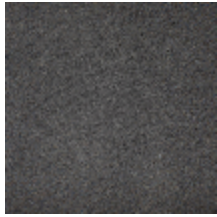
0324-40 NABAB - POIVRE