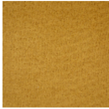
0324-46 NABAB - GENTIANE