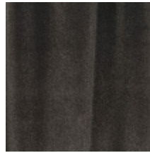
0324-17 NABAB - FUSAIN *