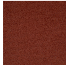
0324-50 NABAB - TOMETTE