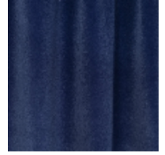
0324-07 NABAB - OUTREMER