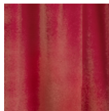
0324-26 NABAB - FLAMANT *