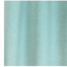
0324-12 NABAB - CALCEDOINE *