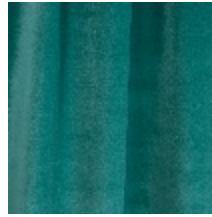
0324-11 NABAB - BENGALE