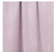
0324-58 NABAB - PARME