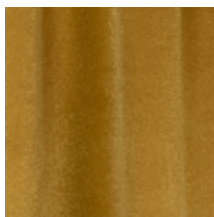
0324-22 NABAB - ECAILLE