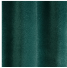
0324-09 NABAB - CANARD