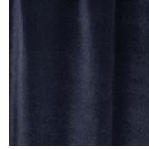
0324-06 NABAB - MARINE