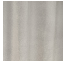
0324-13 NABAB - FUMEE