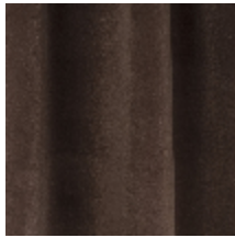
0324-15 NABAB - ECORCE *