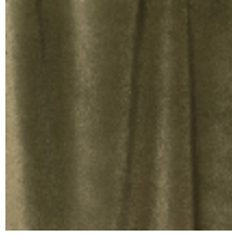
0324-02 NABAB - KAKI