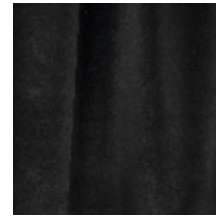
0324-18 NABAB - NOIR