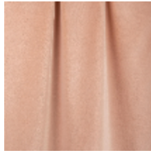
0324-48 NABAB - NUDE