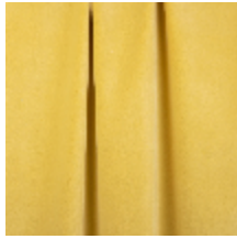
0324-47 NABAB - LEMONCELLO