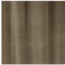
0324-14 NABAB - TAUPE