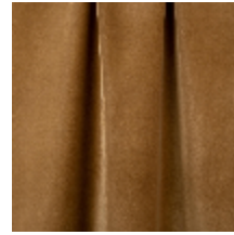
0324-44 NABAB - MOKA