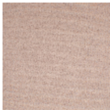
0324-59 NABAB - LOUTRE