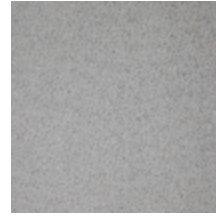
0324-38 NABAB - BRUME