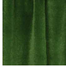
0324-05 NABAB - MYRTE