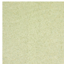
0324-62 NABAB - AMANDE