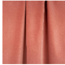
0324-49 NABAB - SORBET