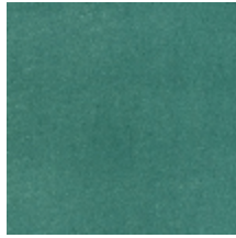
0324-10 NABAB - AGAVE *