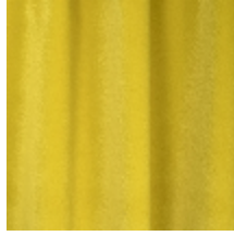
0324-04 NABAB - POLLEN *