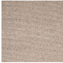
0324-41 NABAB - KRAFT