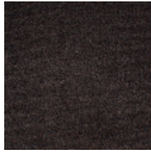
0324-42 NABAB - TRUFFE