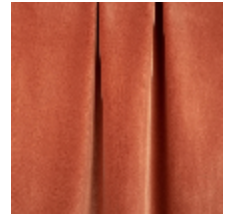
0324-51 NABAB - TERRACOTTA