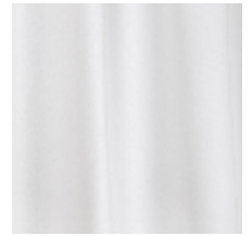
0324-19 NABAB - NEIGE