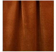
0324-45 NABAB - ALEZAN