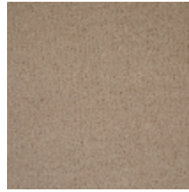
0324-43 NABAB - DUNES