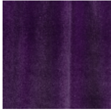
0324-33 NABAB - PETUNIA *