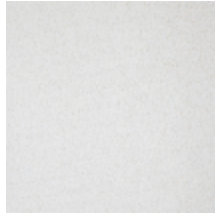
0324-36 NABAB - ECRU