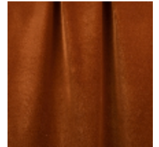
0324-45 NABAB - ALEZAN