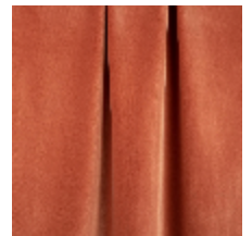
0324-51 NABAB - TERRACOTTA