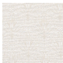
3247-01 DATTIER - NATUREL