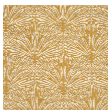
3247-02 DATTIER - MORDORE