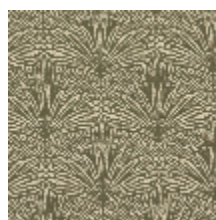
3247-05 DATTIER - KAKI