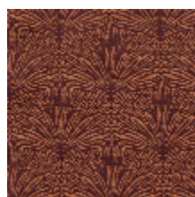
3247-06 DATTIER - BRUGNON