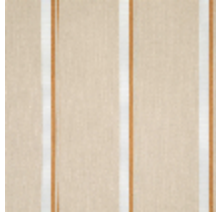
3251-02 ACACIA - FICELLE