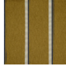
3251-06 ACACIA - GENTIANE