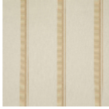
3251-01 ACACIA - NATUREL