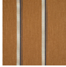
3251-04 ACACIA - GAZELLE