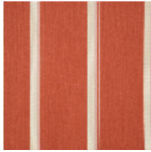
3251-09 ACACIA - PAPRIKA