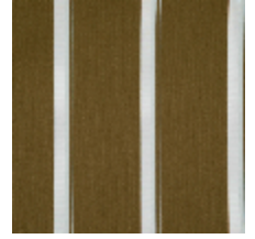
3251-07 ACACIA - BRONZE