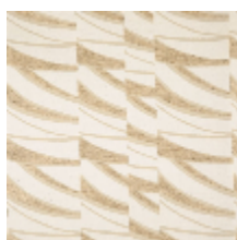
3261-01 DUNES - BEIGE