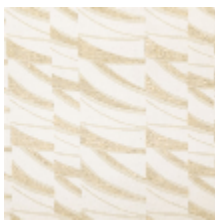
3261-03 DUNES - ECRU