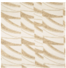
3261-01 DUNES - BEIGE