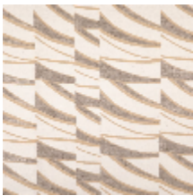
3261-02 DUNES - FICELLE