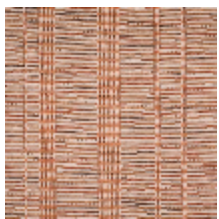
3263-01 SILLONS - TERRACOTTA