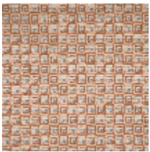
3264-01 NOMADE - TERACOTTA