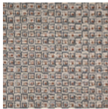
3264-03 NOMADE - GRIS BLEU