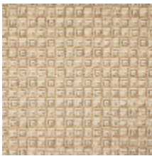
3264-02 NOMADE - BEIGE