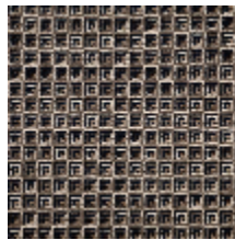
3264-04 NOMADE - MARINE