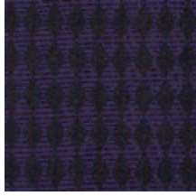
3266-01 LES ENCRES - BIG LOSANGE